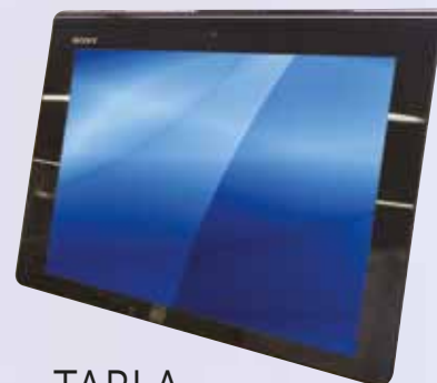
TABLA SONY SGP121