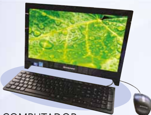
COMPUTADOR TODO EN UNO LENOVO