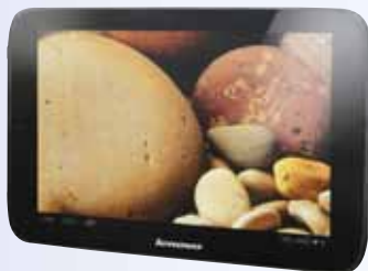
TABLA LENOVO 10.1