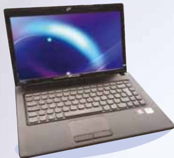
COMPUTADOR PORTÁTIL LENOVO G-475E300