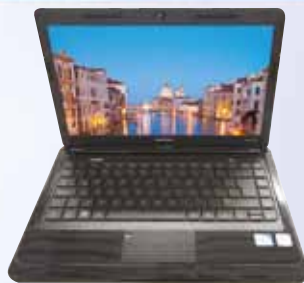
COMPUTADOR PORTÁTIL COMPAQ