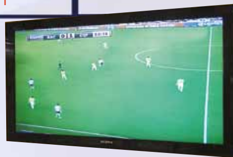
TELEVISOR LCD SONY 32"