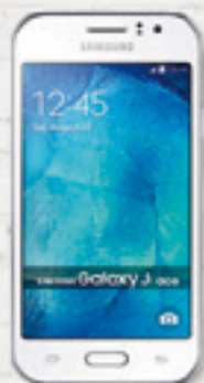
SAMSUNG J1 $ 56.605 A 8 CUOTAS