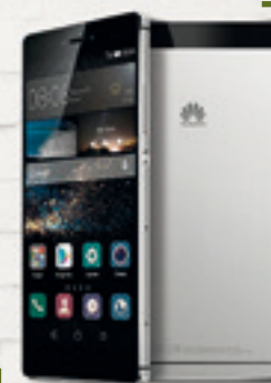
HUAWEI P8 $ 96.768 A 8 CUOTAS