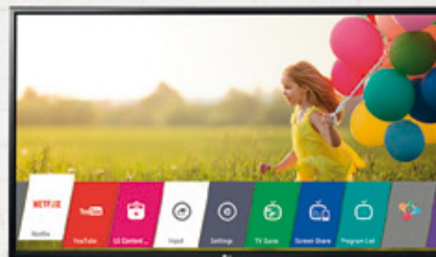
LG 32" LED SMART LIFE GOOD $ 71.360 A 18 CUOTAS