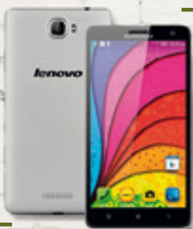
LENOVO S856 $ 75.303 A 6 CUOTAS