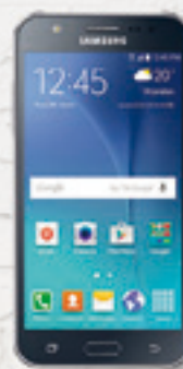
SAMSUNG J7 $ 59.346 A 18 CUOTAS