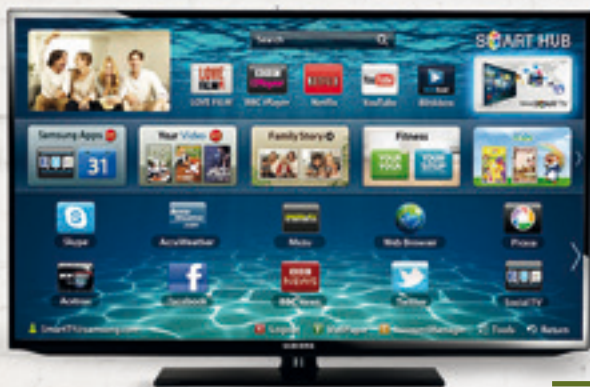
SAMSUNG 32" SMART TV $ 67.934 A 18 CUOTAS